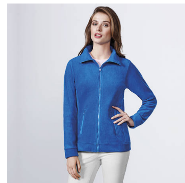
PIRINEO WOMAN CQ1091