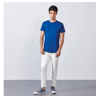
DOGO PREMIUM CA6502