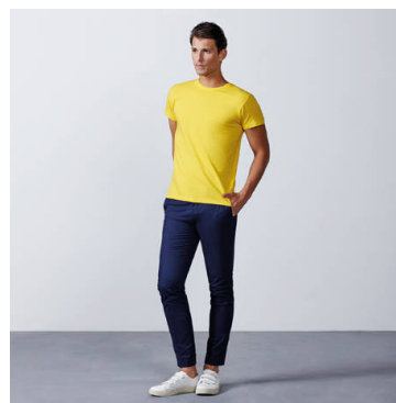
ATOMIC 150 CA6424